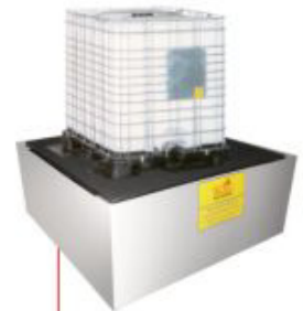
1500x1500x800mm Pallet para IBC'S Material: Polietileno Cap. Contenção: 1600 litros Cód. Tk4050