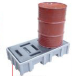
300x1270x670mm Pallet 2 tambor Modelo Universal Polietileno Cód. TK14109