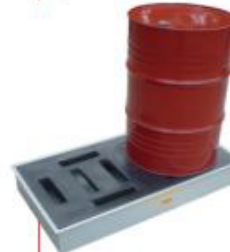
170x1250x650mm Pallet 2 tambor Baixo perfil Polietileno Cód. TK14105 Aço Cód. TK14106