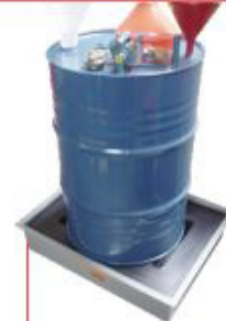
170x650x650mm Pallet 1 tambor Baixo perfil Polietileno Cód. TK14101 Aço Cód. TK14103