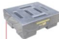
300x650x650mm Pallet 1 tambor Alto perfil Polietileno Cód. TK14102 Aço Cód. TK14104