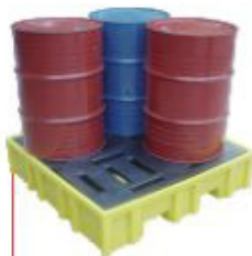
300x1270x1270mm Pallet 4 tambor Modelo Universal Polietileno Cód. 14110