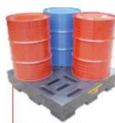
300x1250x1250mm Pallet 4 tambor Alto perfil Polietileno Cód. TK10302 Aço Cód. TK10304