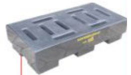
300x1250x650mm Pallet 2 tambor Alto perfil Polietileno Cód. TK10301 Aço Cód. TK10303