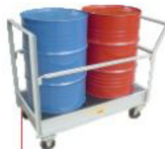
300x1250x650mm Carro Pallet p/ 2 tambor com barras protetoras laterais removíveis Aço Cód. TK14111