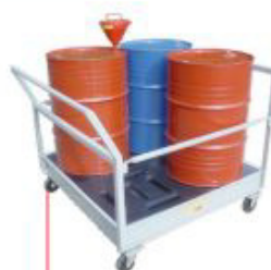
300x1250x1250mm Carro Pallet p/ 4 tambor com barras protetoras laterais removíveis Aço Cód. TK14112