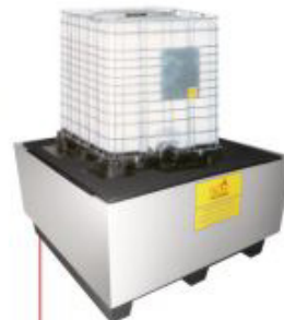
1500x1500x1000mm Pallet para IBC'S Material: Polietileno Cap. Contenção: 1600 litros Cód. TK4070